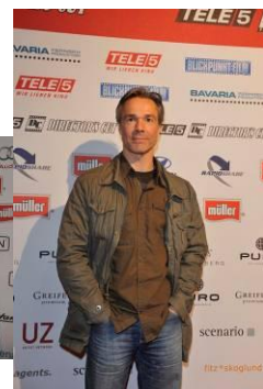
Gäste beim TELE 5 Director's Cut: Bettina Zimmermann, Veronica Ferres und Thomas Gottschalk, Annemarie Warnkross und Wayne Carpendale, Anita und Elmar Wepper, Hannes Jaenicke