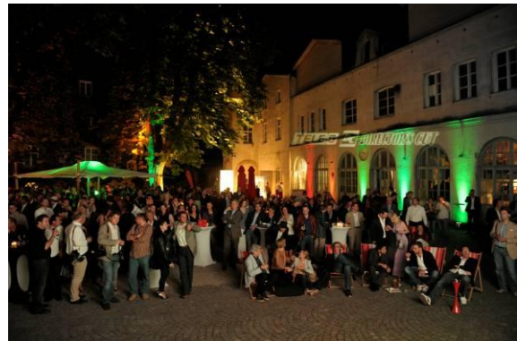
Nach dem Talk: TELE 5 Director's Cut Night in Berlin (Puro Lounge) und München (Praterinsel)